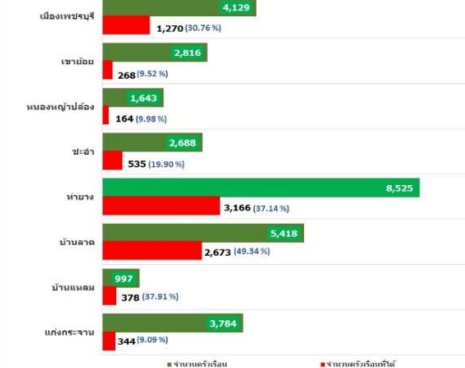
ผลการวาดแปลง

เป้าหมาย ปี 68 รอบที่ 1 (1 ต.ค. 67 - 10 มี.ค. 68)